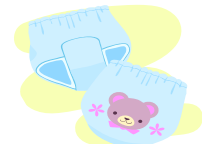
尿 ㄩ 布 ㄩ