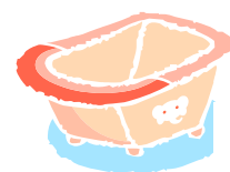
浴 ㄩ 缸 ㄩ