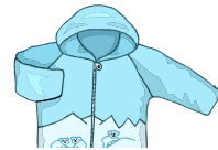
夾 ㄩ 克 ㄩ