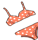
泳 ㄩ 衣 ㄩ