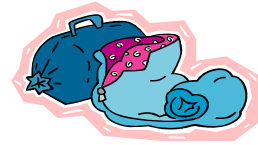
睡 ㄩ 袋 ㄩ