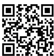
《垂頭喪氣 OUT!-彎腰駝背提醒裝置》