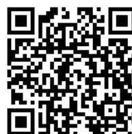
《思創．Strong-澳洲森林大火》